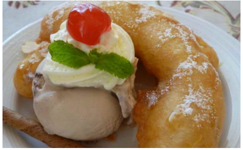
Friterad banan Servertas med vanliglass. 89:-