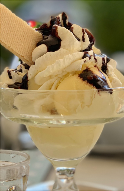
Vaniljglass med chokladsås 59:-